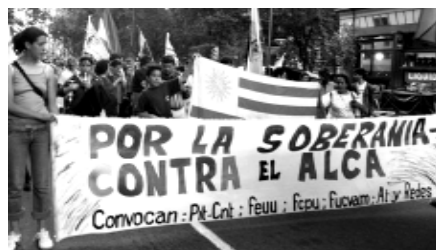
Marcha de estudantes e professores contra ALCA - Uruguai

Por essa razão, desde já convidamos as seções da Internacional Revolucionária da Juventude (IRJ) a se engajarem na construção de delegações de toda América associando jovens das mais diversas organizações e entidades estudantis que se colocam na luta contra a ALCA.