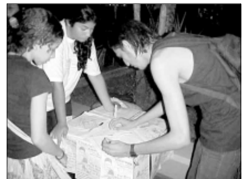
Banca de contra a guerra no Acre