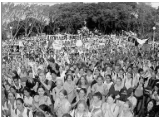
50 mil estudantes contra a guerra na Austrália (5/03)

É impossível nos calarmos diante disso. Nega nosso direito a um futuro, negando trabalho de verdade, com direitos. Negam o estudo de verdade com um verdadeiro diploma. Nos empurram às drogas, para nossa destruição física e alienação intelectual. A violência e a fome são o cotidi-